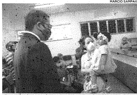
Campanha de vacinação busca imunizar 95% do público-alvo

O governo do Estado deu início, nessa segunda-feira (5), às ações da Campanha Nacional de Vacinação contra a Poliomielite e Multivacinação. A mobilização abrange todos os 217 municípios maranhenses e se estenderá até o dia 30 de outubro. A meta é imunizar 35% do público-alvo, que são crianças de 12 meses a menores de 5 anos contra a Poliomielite, e menores de 15 anos para preenchimento da carteira vacinal, conforme o calendário estipulado pelo Ministério da Saúde. "Neste ano de 2020, em decorrência da pandemia, a queda da busca pelos postos de saúde para imunização teve um declínio maior. Pedimos a colaboração dos municípios, mas especialmente dos pais e responsáveis para que tragam as suas crianças para que elas sejam protegidas contra as doenças", disse o secretário de Estado da Saúde, Carlos Lula. Nos postos de saúde, os pais ou responsáveis das crianças e adolescentes deverão apresentar documento com foto do paciente, incluindo a carteira de vacinação. O objetivo é promover e conscientização